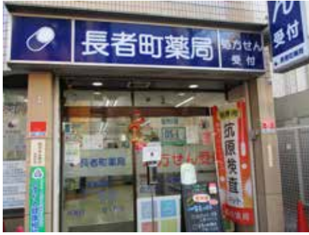
▲ 営業時間は9時から19時まで 木曜は17時、土曜は16時まで 日曜・祝日は休み