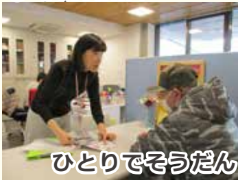
ひとりでそうだん