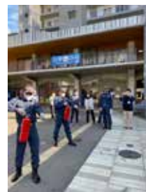
センターの広場 で行われた過去の 訓練の様子