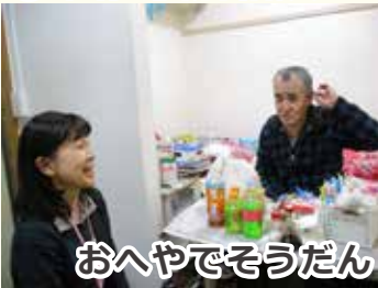
おへやでそうだん