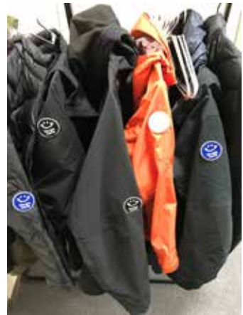
▲腕の部分にワッペンが入っている