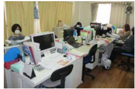
▲ケアマネージャーの部屋