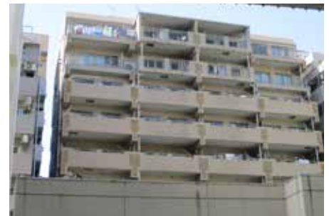
▲現在の事務所の入っている建物