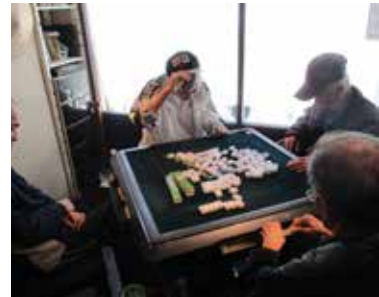
▲人気の健康マージャン