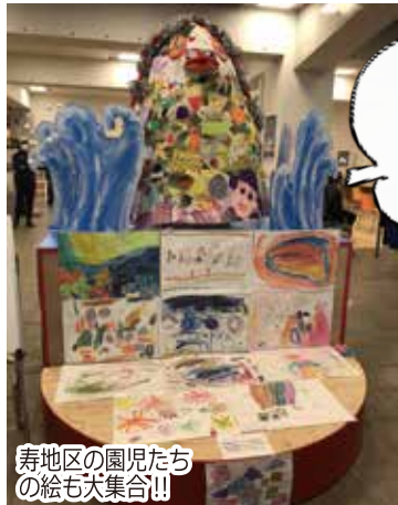
寿地区の園児たちの絵も大集合!!