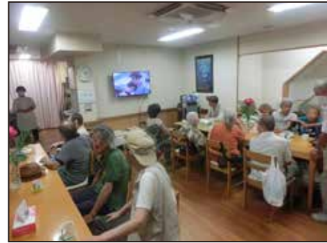
▲ なじみの曲が流れるなか、利用者がくつろいでいた。