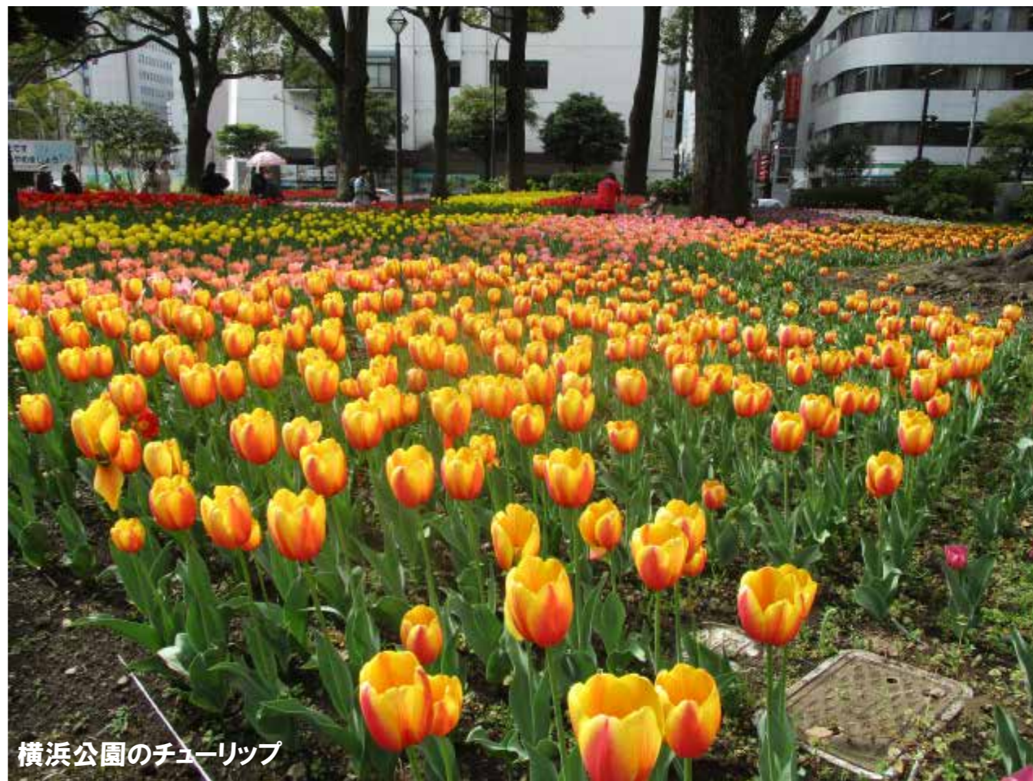
横浜公園のチューリップ