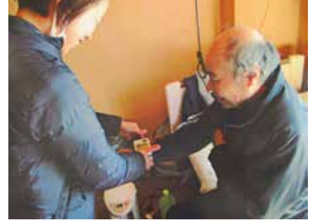
▲ なかサービスの事業所は花園ビルの2階にある