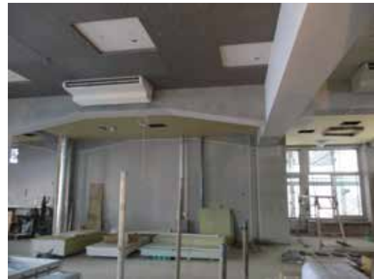
▲天井が高く開放感あふれる1階

建物の中に戻るにゃん！ さっきの健康コーディネイト室の奥には活動・交流スペースがあるにゃん。会議室2つと自由利用スペース。分けて利用もできるけど、全部一括予約もできるにゃん。自由利用スペースだけなら予約無用にゃん。炊き出しでいつも配食してる人達が会議室で話し合いをしてるにゃん。会議室前のフリースペースには、寿地区の歴史や地域の取り組みが展示されているから、研修などで来ている地区外の人たちが熱心に閲覧しているにゃん。