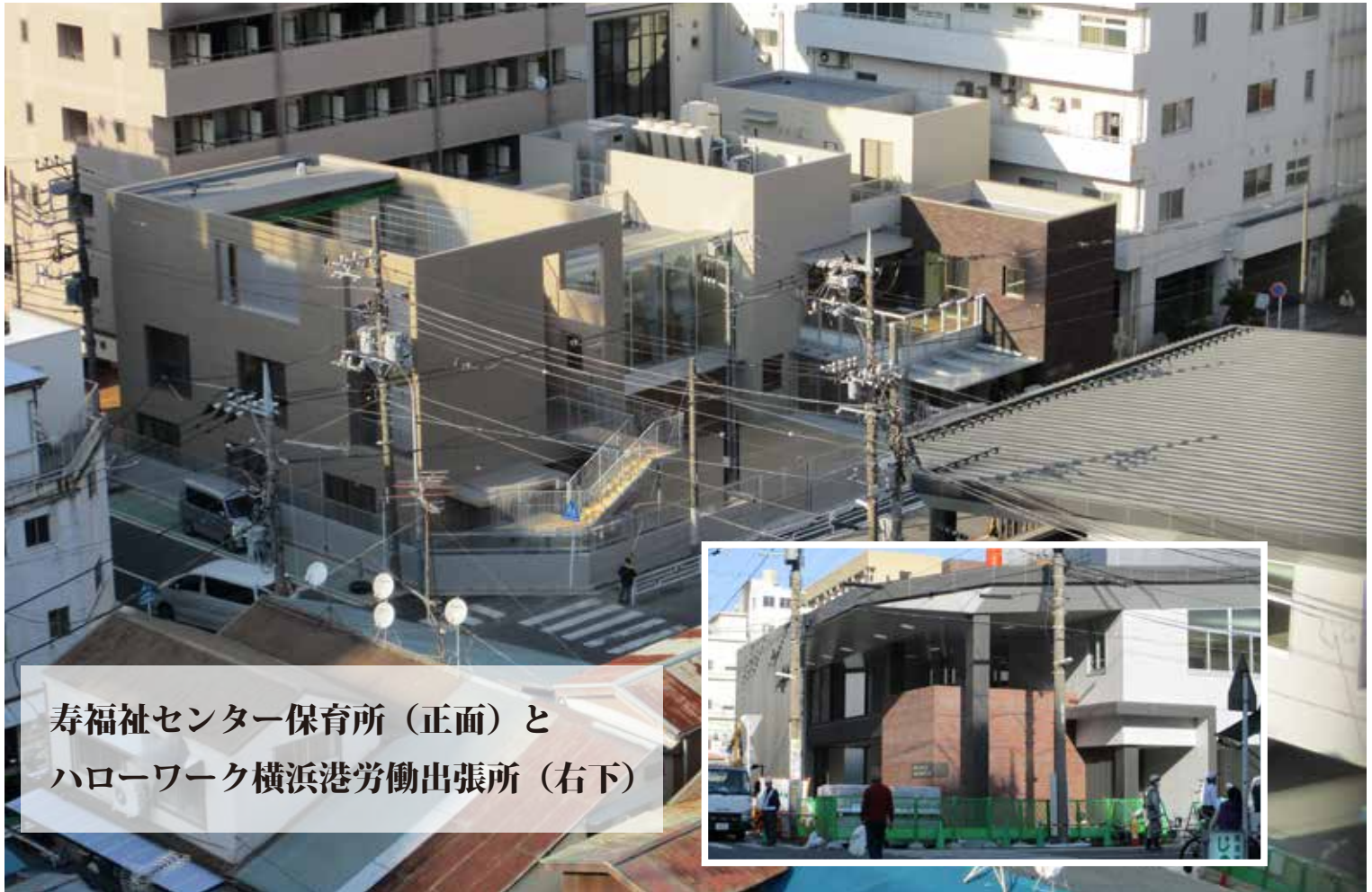
寿福祉センター保育所（正面）と ハローワーク横浜港労働出張所（右下）