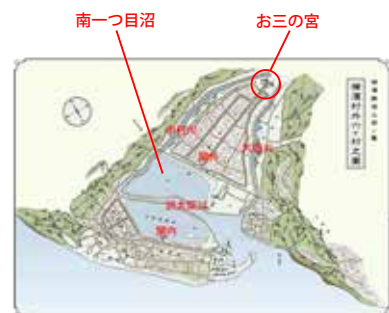
▲ 南一つ目沼が寿地区となる前の図

寿地区が他の埋め地に比べて、比較的小規模の整形地になっているのは、埋め立てられたのが明治時代初期であり、住宅地等として販売されることを想定していたからであろう。今日の寿地区をはじめ、横浜市の都心部があるのはこうした先達の献身の結果であり、心から感謝したい。