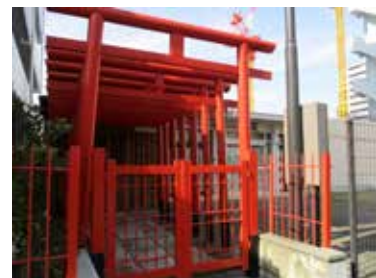
▲美しい幾重の鳥居に埋地の願い

その後、相談センターの南区移転により、空き家となった施設の一部を、町内会館として今日まで活用。町内会館には、お三の宮の秋祭り（9月中旬）の氏子町内神輿（みこし）が安置されています。