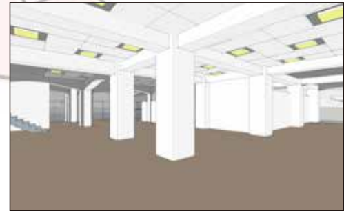
▲（左）ロビー脇の階段で2階へ

ええ雰囲気だにゃあ！ 期待高まり、いざ2階に！ 警備員さん、急いで失礼するにゃん。