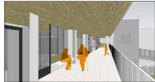
▲ 2階 ひさしのある“縁側”

診療所の診察（内科・精神科）は、今と同じ午前9時20分受付開始にゃん。朝並ぶ人は、屋外階段またはエレベーターで2階に上がり、ひさしのある縁側で待つことができるようになるにゃん。待合室も今より広くなるし、待合室の図書類も増えるみたいになん。