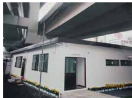
▲まつかげ宿泊所のB棟（平成6年当時）

《平成25年2月～》地区内のライフライン再整備事業の資材置き場や駐車場として、道路・上下水道・ガス管等数十年ぶりの更新に貢献し今も続行中です。そして現在、《平成28年3月末～》当協会の仮設会館敷地となり、皆さんに健康と生活の潤いを提供しています。