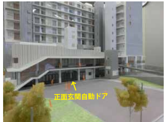
▲センターの正面外観（広場側から）

意外な展開にゃん! カッコいい“007風”じゃないけど、まあいいかにゃあ。次回も期待してにゃあ。