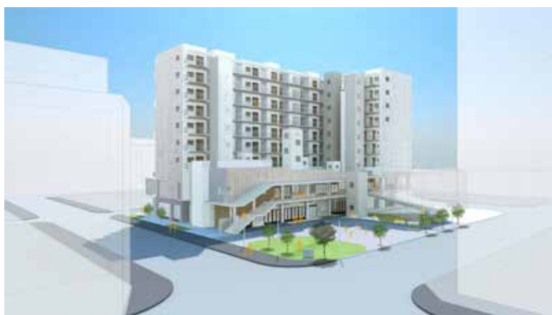
新センターの完成予想図 ▶

新シリーズでは、新センターの周辺や広場、センター内各施設をご案内しつつ、利用者の皆様にとどのような利用上のサービスを提供し、運営をしていくのか、イメージし易くご紹介したいと考えています。当協会では来年度に向け、仮設会館運営の中でも新しいチャレンジをしています。皆様も心の高まりを増幅させ、新センター開設時にはどっと繰り出して下さいませ!