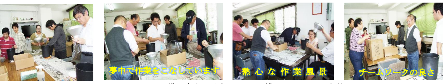
☎231-0033 横浜市中区長者町1-3-10 横浜ペインティング 第3ビル 3F 045-315-2678

作業は…豆や果物の乾燥物、お茶などを計量して小袋に分けラベルを貼ったり、チラシをセットしたポケットティッシュ作り、ワインの箱作り、など色々だが、食べ物の扱いにはマスク・手袋・エプロンを着用するなど神経を使う。工賃が上がらないのが悩みだが、その分、レクリエーションにも力を入れる。“最後の受け皿(?)”と期待される『利用者第1主義』の事業所です。