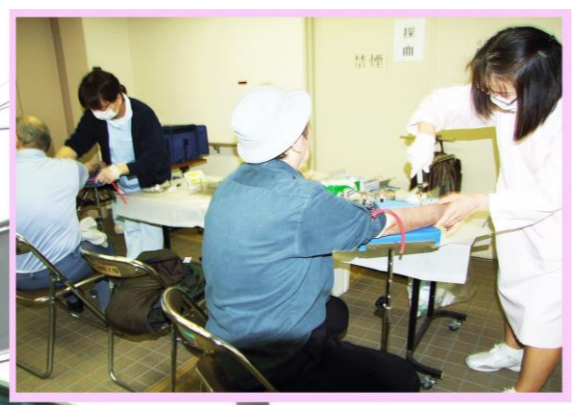
4月24日(月) 横浜市中区福祉保健センター 無料結核検診 & 寿町勤労者福祉協会 無料健康診断