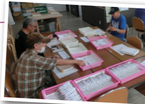
▲てふてふでの作業風景。皆さん、イキイキと作業されています