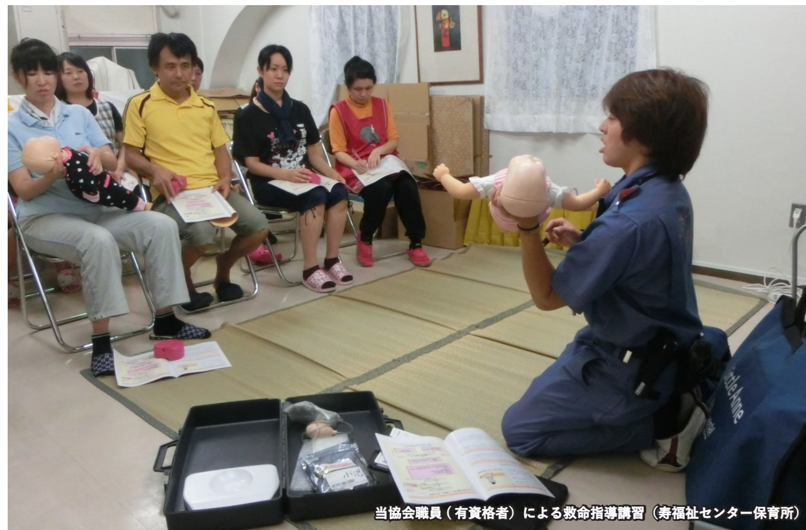
当協会職員(有資格者)による救命指導講習(寿福祉センター保育所)